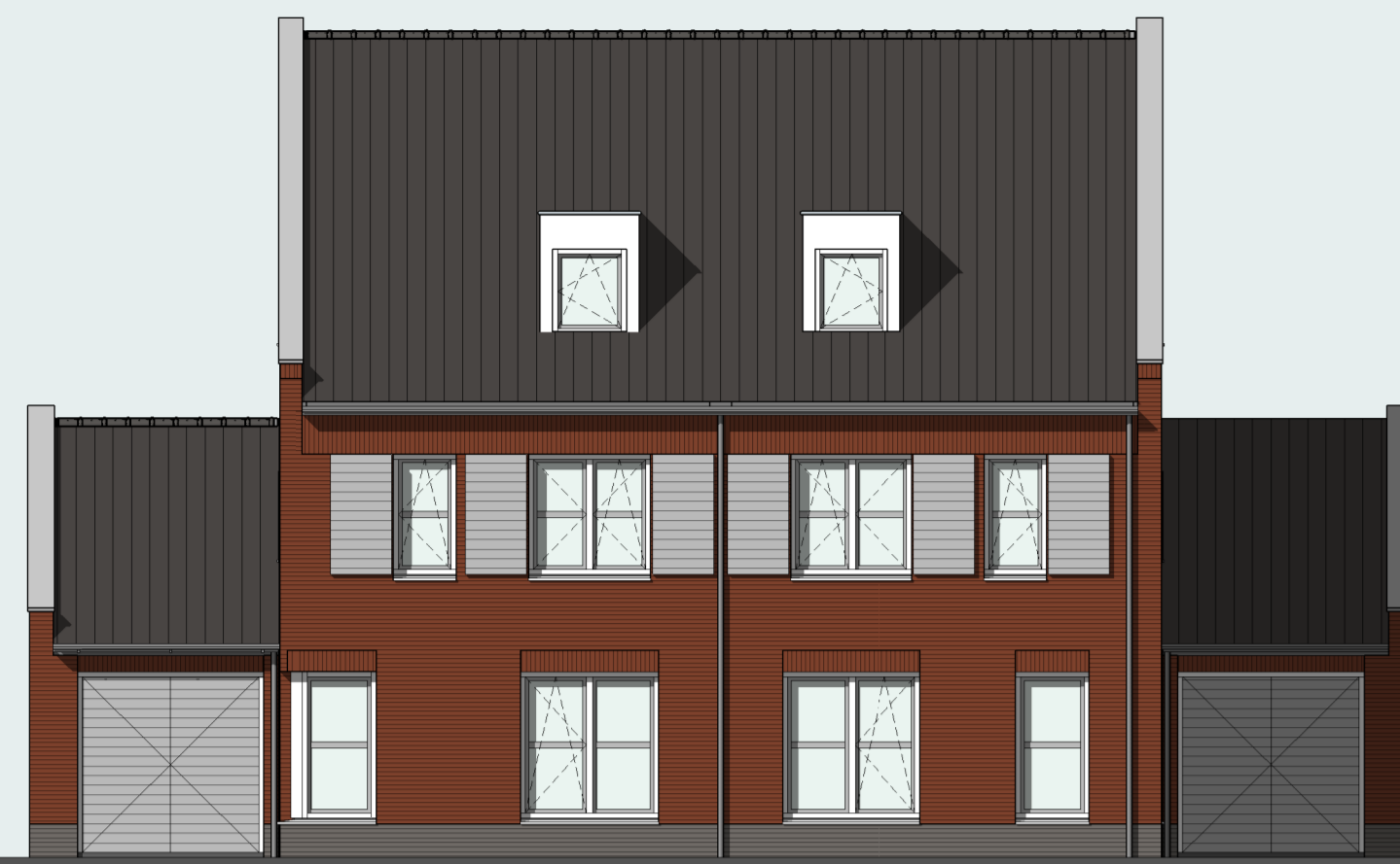
type 29A type 29B