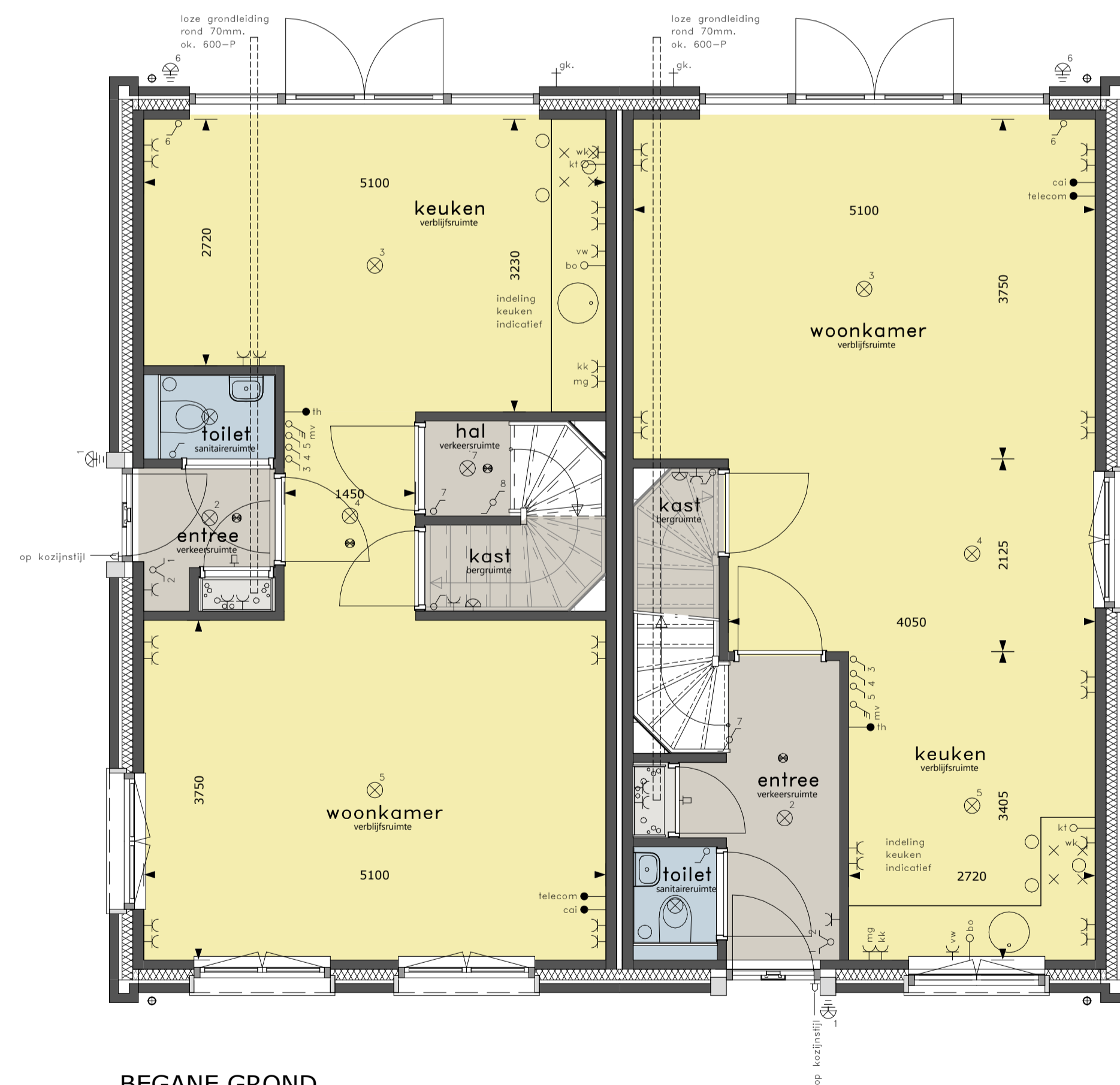
BEGANE GROND schaal 1 : 50