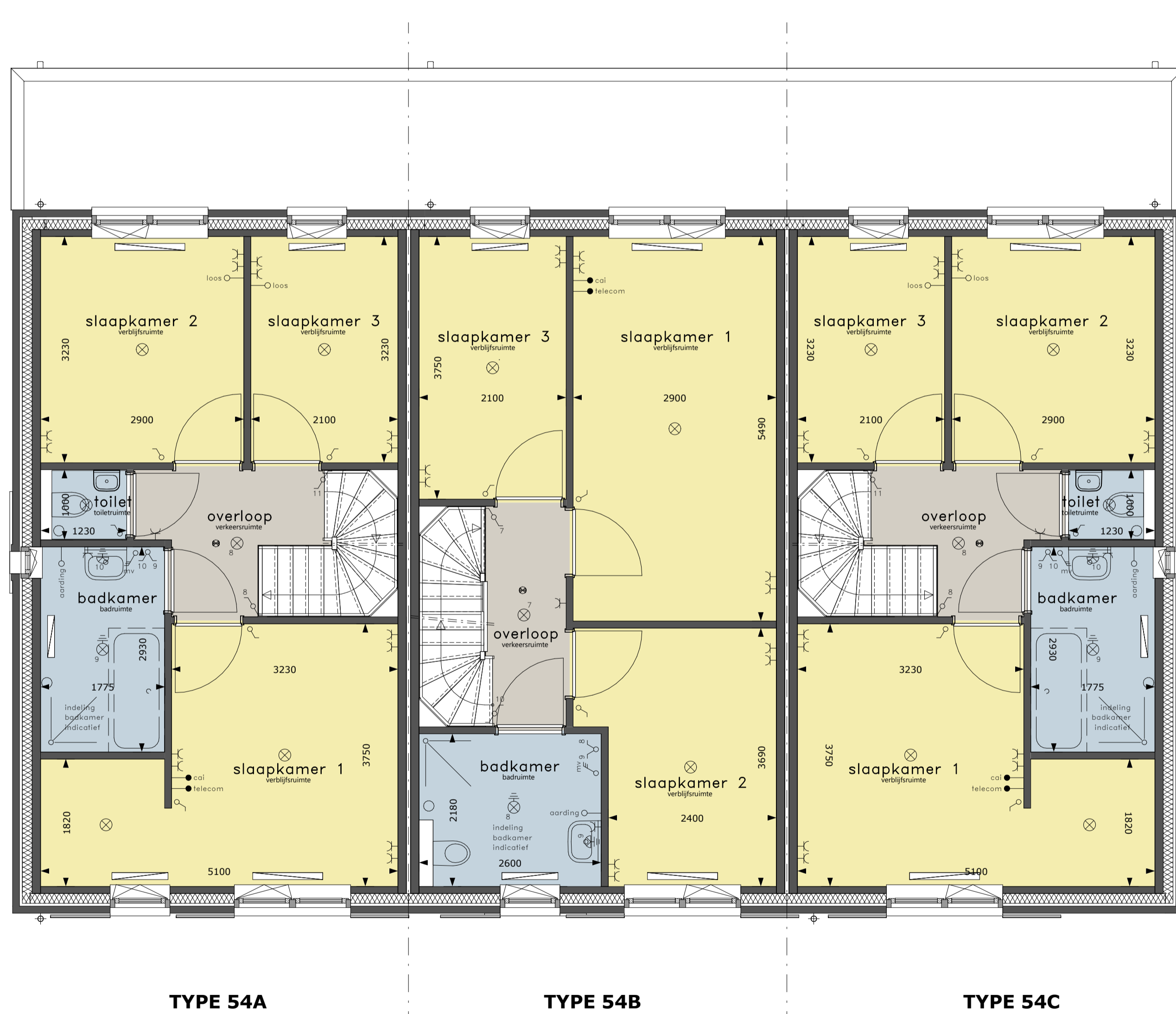
1e VERDIEPING schaal 1 : 50