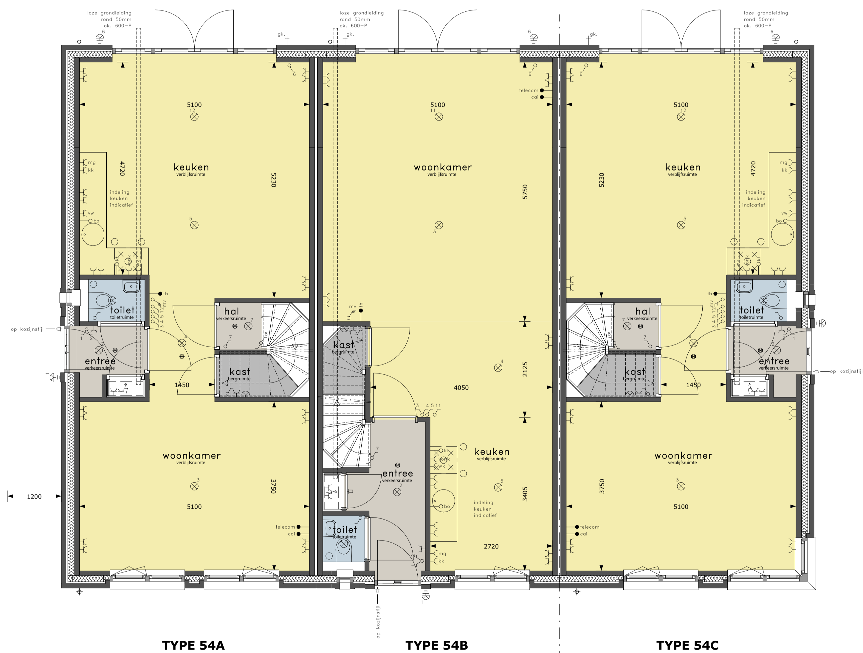
BEGANE GROND schaal 1 : 50